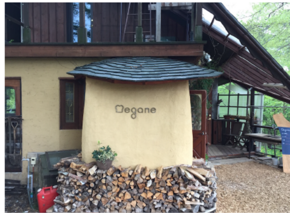
パン工房レストラン megane（めがね） 山梨県北杜市高根町清里 3545-5553 TEL. 0551-45-9565 モーニング 7:30-10:00 ランチ 12:00-14:00