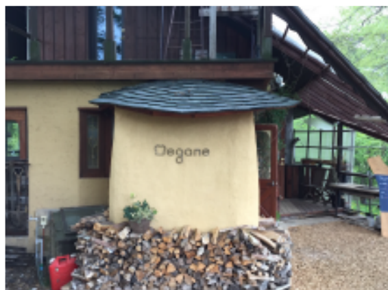
パン工房レストラン megane（めがね）

フレンチシェフのオーナーが調理するモーニングとランチ料理も大人気、特にモーニングは早く並ばないと売り切れてしまうのでご注意ください。そのような時は店内でバケットやスコーン（週末のみ）をコーヒーと一緒にいただいて、明日の早起きを誓うのです。（森下）