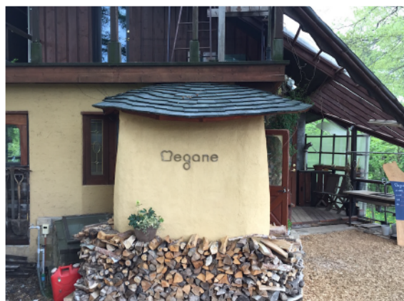
パン工房レストラン megane（めがね）

フレンチシェフのオーナーが調理するモーニングとランチ料理も大人気、特にモーニングは早く並ばないと売り切れてしまうのでご注意ください。そのような時は店内でバケットやスコーン（週末のみ）をコーヒーと一緒にいただいて、明日の早起きを誓うのです。（森下）