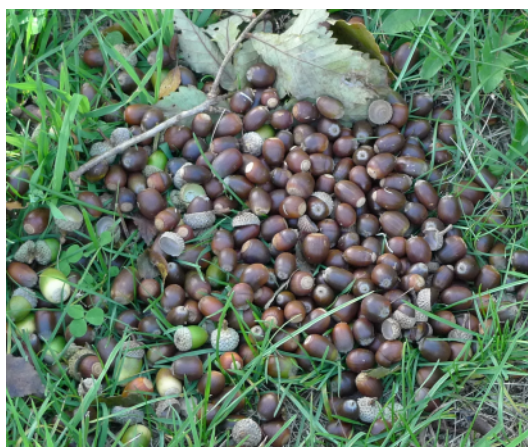
拾ってきたドングリたちの一部です。大きく育ったものや昨日までの風で落とされたまだ青いものなど。

講義の後、参加者みんなでドングリを植え付ける牛乳パックのコンテナ作り。午前中はサンメドウズのヤツガタケトウヒ見学の後、演習林でドングリを拾って、午後は牛乳パックに植え付ける手順を進める段取りということで、まずは車に乗り合わせてヤツガタケトウヒ見学に出かけました。初めて球果を見る会員もいて、小一時間道路際での鑑賞会を楽しみました。再び車に分乗して八つ演習林へドングリ拾いに。12 時近くまで拾い集め、お腹を空かせて帰ってきました。