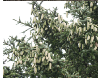
ヤツガタクトウヒの樹形と球果