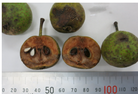
アオナシの実と断面

お昼を食べて、いよいよ植え付けです。ここでもう一つのイベントが……。正門に入って正面にアオナシの木があり、熟した実の良い香りが漂っていて、ついつい誘われて木の下に集まってしまいました。アオナシの香りはう・フランスのような甘い香り。果実酒にもぴったりの香ります。アオナシと似ている木にヤマナシがあるそうですが、実の枝側の反対側に花の萼が残っているかないかで違うのだそうです。日本の梨はアオナシとヤマナシの交配改良で今の形になったという説もあります（これは学術的な裏付けは確認できていませんが……）。