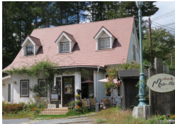
パスタと肴 MoRimoTo 山梨県北杜市高根町清里 3545-6402 0551-48-2118 木曜定休 11:30-14:00、18:00-22:30 (L.O.)