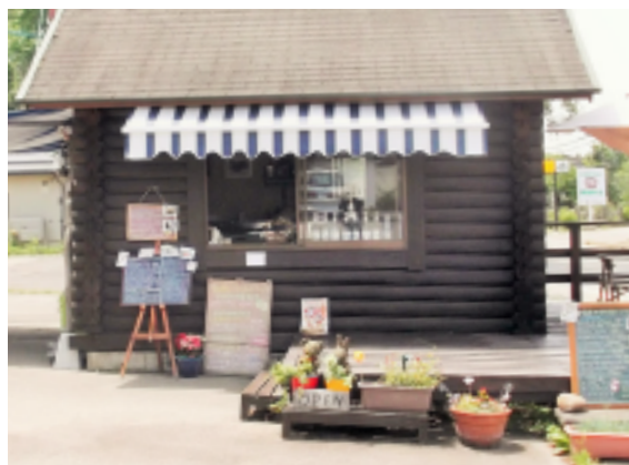
Take out cafe カントリー

野辺山駅から 100m、八演管理棟から 1,200m ほど離れた野辺山高原ホテルの駐車場にちょこんと作られた可愛いカフェ。お店の名前には「テイクアウト」とありますが、パラソルとテーブルセットが設置されているので、その場でいただくことも可能。豊富なメニューはコーヒーとホットサンドで 500 円くらいから選ぶことができます。どれもおいしそうなので目移りしてしまいそう。残念ながら冬の間は休業となってしまうので、公式 web ページ http://cafe-country.com の「お知らせ」で、お休みの日と営業時間などを確認してからお出かけすることをおすすめします。（森下）