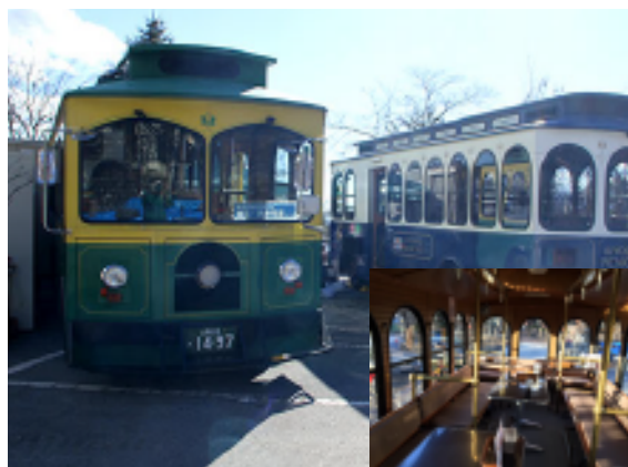
ブルーバブレストラン ROCK

説明するまでもないですね、清里「萌木の村」の原点、みんなのレストラン ROCK。昨年8月の火災で全焼してしまいましたが、すぐに仮設店舗での仮営業を開始。12月からは冬季休業中の清里ピクニックバス2台の支援を受け、古き良き時代の食堂車のような雰囲気の中で食事することができるようになりました。向かいのホテルレストラン・ネストでもROCKのカレーを提供しています。毎年2月のお楽しみ「寒いほどお得フェア」にももちろん参加（プレ開催は1月15日から）。基本的にはネストで、ネストが休業の日はピクニックバス仮設店舗で適用されるそうです。頑張れROCK！（森下）