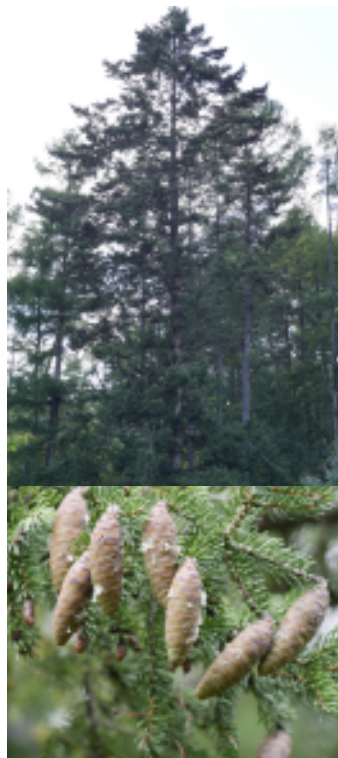
ヒメバラモミの樹形と球果

ヤツガタケトウヒの繁殖力は大きくなく、'ヤツガタケトウヒとヒメバラモミは 6 月に風媒花をつけ、10 月に球果が成熟するが、毎年同じように開花・結実するわけではない。まったく開花しない年もあり、大豊作年は 10 年に 1 度くらいである' という記述があり、またまたその保存の意味も、'ヤツガタケトウヒとヒメバラモミは、2 万年前の氷河期には東日本に広く分布していたことが化石記録から明らかとなっている。また現在の分布地の気候は、比較的寒冷で降水量や積雪深が小さいことが特徴である。したがって、数万年単位のスケールで見ると、現在の温暖で湿潤な日本列島の気候の中、2 種は自然に衰退しつつある氷河期の遺存種であると考えられる'、また、'ただしこの 100 年の間に限ってみると、森林伐採とカラマツ植林がもっとも大きな減少要因としてあげられる。2 種は山火事跡地や伐採跡地に更新するため、森林伐採は必ずしも悪影響だけではない。しかし、後継樹がない状況での伐採は、集団を消失へと導く' ということから、人間が考えていくべきことだろうと思われます（引用出典：独立行政法人森林総合研究所・希少樹種の現状と保全）。