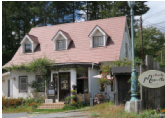
パスタと肴 MoRimoTo 山梨県北杜市高根町清里 3545-6402 0551-48-2118 木曜定休 11:30-14:00、18:00-22:30 (L.O.)