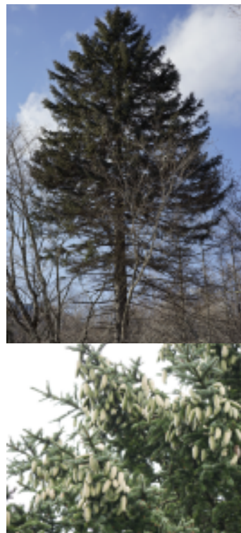
ヤツガタクトウヒの樹形と球果