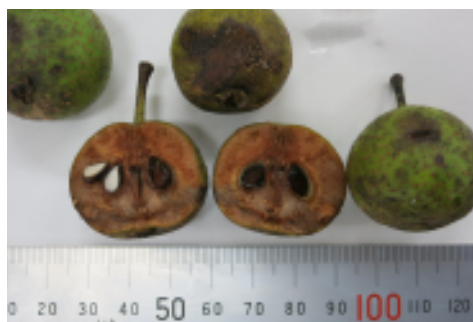
アオナシの実と断面

お昼を食べて、いよいよ植え付けです。ここでもう一つのイベントが……。正門に入って正面にアオナシの木があり、熟した実の良い香りが漂っていて、ついつい誘われて木の下に集まってしまいました。アオナシの香りはう・フランスのような甘い香り。果実酒にもぴったりの香ります。アオナシと似ている木にヤマナシがあるそうですが、実の枝側の反対側に花の萼が残っているかないかで違うのだそうです。日本の梨はアオナシとヤマナシの交配改良で今の形になったという説もあります（これは学術的な裏付けは確認できていませんが……）。