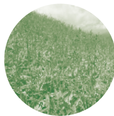
何度登っても ササばかり