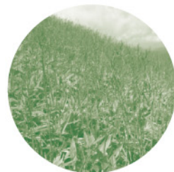
何度登っても ササばかり