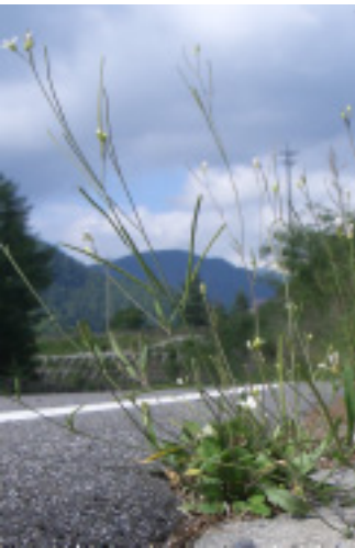
道路脇に生えていることも。