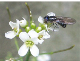
白い花にはハエやアブがやってくる。

ついています。一方、ミヤマハタザオは自分の力で、高山で子孫を残します。その意味では、標高に対する万能性は、ミヤマハタザオに軍配が上がるでしょう。