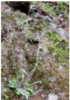
自然の岩場で咲く

につながります。また、地球が温暖化する時に生き物がどうなるのかを予測し、対策を考えるヒントを見つけていることが