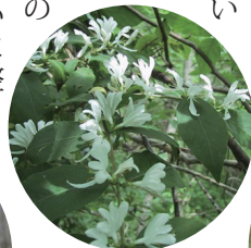
樹木園に咲く花々 左:カタクリ 中:ハナヒヨウタンボク 右:オニヒヨウタンボク

囲気を醸しています。樹木園では枯れ木や枯れ枝の整理を行い、園内の観察路もきれいに整備しました。増えすぎたハリエンジュを伐採し、低木にも光が注ぐようにした結果、オニヒヨウタンボクやハナヒヨウタンボクも息を吹き返し、かわいらしい花を咲か