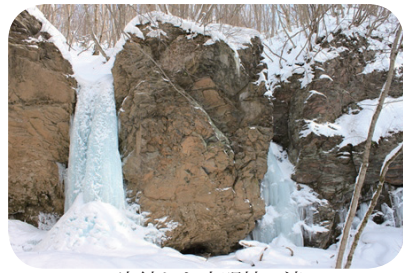
氷結した大明神の滝

草の奥のアカマツ林や広葉樹林、その奥の大明神沢の森林には研究教育用の観察道の整備が完了し、ミズナラなどの大木たちとの出会いを楽しむことができます。今年も大明神の滝は氷結し、神秘的な姿を見せてくれるでしょう。春、雪解けとともに草原も森林も新緑が萌え、その生命に満ちた景観は私たちに大きな力を与えてくれます。