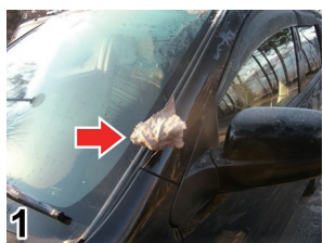
図1 車体に挟まるポプラの枯れ葉(矢印)

晩秋のある日、運転中に「カタカタカタ」という音が車内に響いていることに気が付きました。どうやら音の発信源は、助手席側の車体の表面です。車を隅々までチェックしても、原因がよくわからない……しかし、一枚のポプラの落ち葉が車体の隙間に挟まっていました(図1)。実は、これが異音の犯人だったのです!