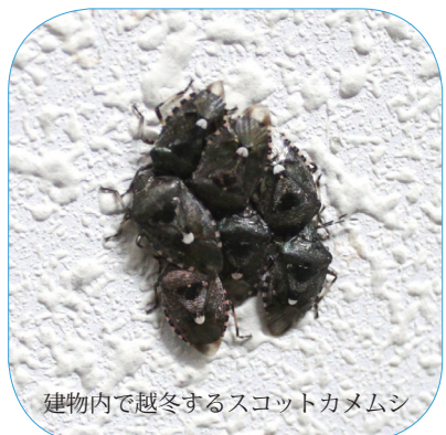
建物内で越冬するスコットカメムシ

冬の初め頃、菅平高原実験センター内には大量のカメムシが目見えます。スコットカメムシという名のこのカメムシ、皆様にも覚えはないでしょうか? 何故冬が近付くと彼らは大