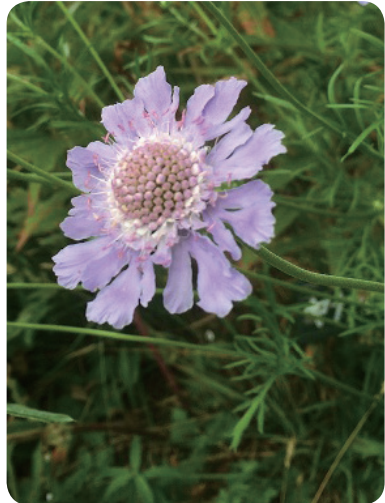
マツムシソウ (峰の原高原にて撮影)

9月は、様々な植物がきれいな花を咲かせます。そのうちの一つが「マツムシソウ」です。マツムシが鳴く頃に花を咲かせることから名がついたそう、まさに初秋を感じさせる花です。