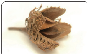
写真2: ブナのドングリ

れば、クマ大量出沒を予測することができます。しかし、ドングリが実るのは秋なので、それを予測に用いていたのでは、遅すぎます。そこで、より早くドングリの量を予測する方法が考えられています。その一つが、雄花(写真3)を用いる方法です。ドングリが豊作の年には、雄花もたくさん咲く傾向があります。雄花は夏には落ちるので、リター・シードトラップに入った雄花が多ければ、その年の秋のドングリの量が多く、クマの出沒は少ないことが予想されます。逆に雄花が少なければ、クマ大量出沒の可能性が高まると予測されます。しかし、ドングリの豊凶予測によるクマ大量出沒の予測には、まだいくつかの問題点が残っています。