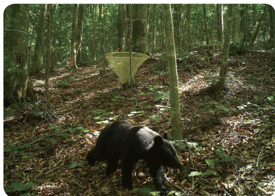
写真1: 大洞地区のブナ林で撮影されたツキノワグマ。クマの背後に見える白い漏斗状のものがリター・シードトラップ。こんなに近くで活動していることに改めて驚き!

菅平高原の大洞地区には、菅平高原一帯がブナ林だった時代の名残で、伐採されずに残った約200年生のブナが生育しています。菅平高原実験センターでは、2012年から、この大洞地区で、リター(落葉落枝等)調査を行っています。この調査は主に、「リター・シードトラップ」を用いて行います(写真1)。漏斗状の袋を地面に設置し、落ちてくる葉や枝、種子などを集めます。定期的に回収して、リターの種類や量などを計測するという仕組みです。いわば森のごみ箱です。