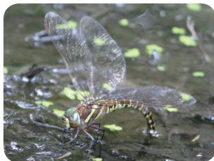
ルリボシヤンマの産卵が見られました。

次号は10月発行予定です 本通信の印刷・配布は、東郷堂さんにご協力いただいています。