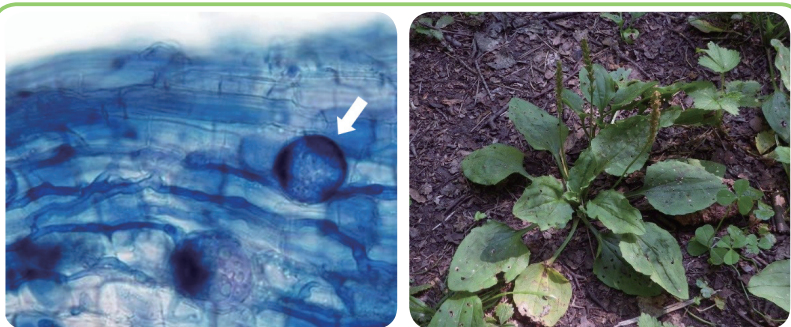
図2: オオバコの根の中で青く染まる菌糸(矢印部分が嚢状体)

陸上植物の多くは、根の部分で菌根という構造を形成して菌類と共生しています。菌根は2種類に大別され、菌糸が植物細胞の内部に進入する「内生菌根」と、菌糸が植物細胞の内部には進入せずに細胞の周囲を取り巻く「外生菌根」があります。外生菌根を形成する菌類としてはハナイグチやマツタケなどのきのこが代表的です。内生菌根はさらにアーバスキュラー菌根、エリコイド菌根、ラン菌根などに分けられますが、今回はアーバスキュラー菌根について紹介します。